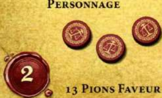
13 PIONS FAVEUR