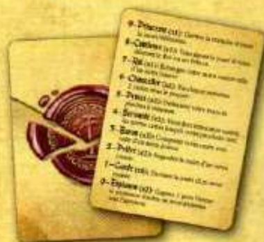
6 CARTES RÉFÉRENCE