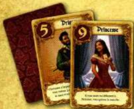
21 CARTES PERSONNAGE